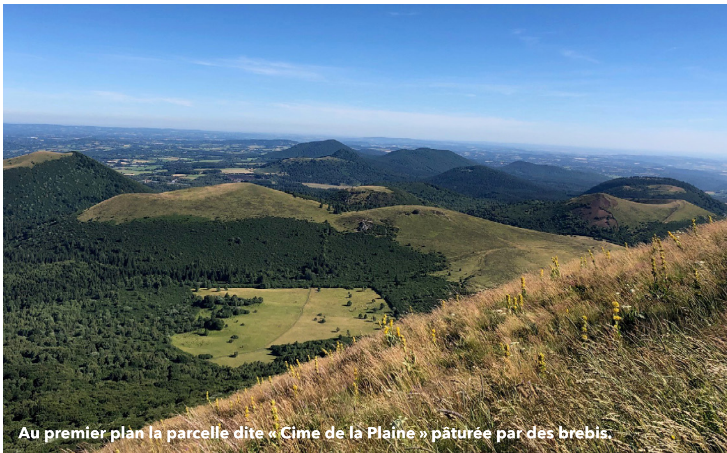
Au premier plan la parcelle dite « Cime de la Plaine » pâturée par des brebis.

Ces deux associations font pâturer des brebis, vaches et autres chevaux en estives, collectives ou non, sur des zones de 625 ha par association, situées entre le puy de Dôme et le puy de Côme.