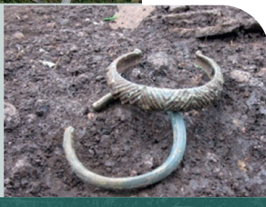
Dépôt de bracelets - âge du Bronze.

La présence d'objets de prestige de cette époque, comme les parures, les armes en bronze, prouvent qu'ils appartenaient à des populations aisées.