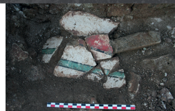
Fragments d'enduits peints à motifs géométriques.

Le site est définitivement abandonné vers 300 apr. J.-C., pour faire place à des friches qui ne seront remises en culture qu'à partir du XVIII e siècle.